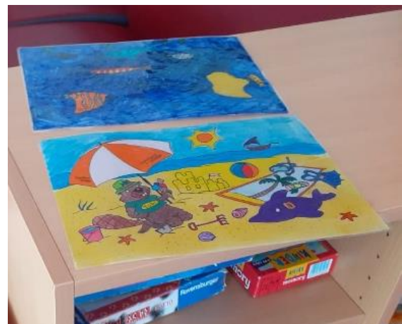
Eine kleine Auswahl an Fensterbildern