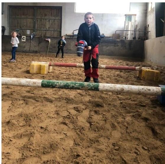
Die nächste Hürde wartet schon auf das Pferdchen.