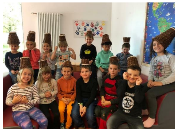
Stolz präsentieren die Kinder ihre gefertigten Weidenkörbe

Als Material eignen sich einjährige Weidenruten, die zur Verarbeitung eine bestimmte Feuchtigkeit haben müssen.