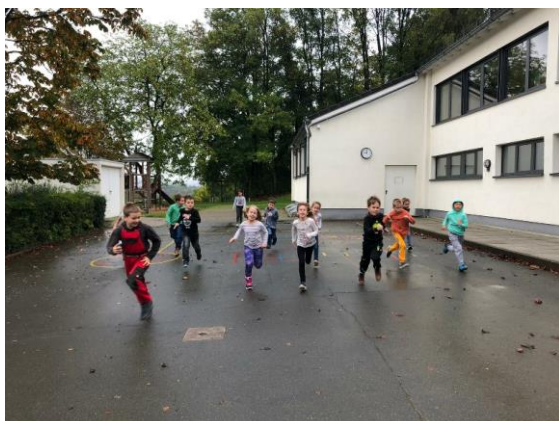
Toben im Schulhof – auch einmal bei Nässe.....