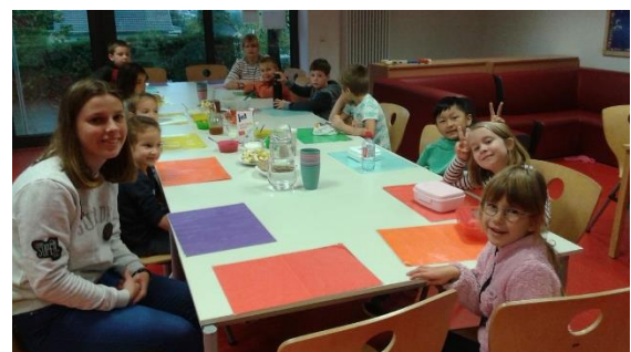
Am großen Tisch fanden alle 14 Kinder einen Platz.