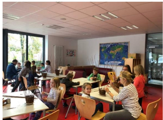
Immer zwei Kids an einem Tisch – die Körbe wachsen