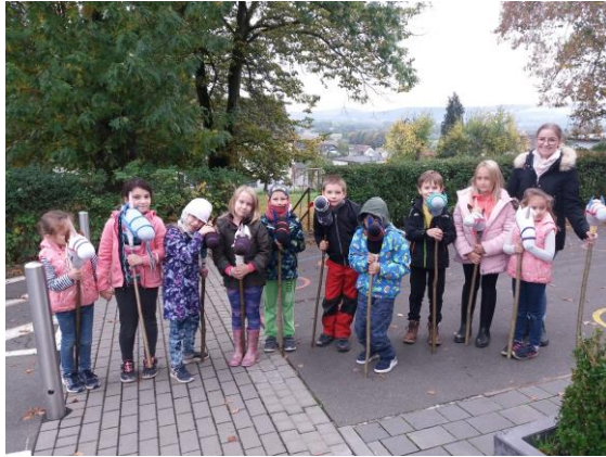
Vor dem Ausritt zur Reithalle am Ortsrand von Niederbiel