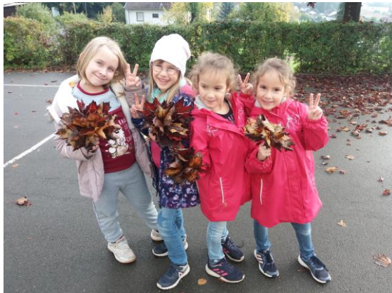
Die Schülerinnen grüßen mit bunten Herbststräußen.

Text: I. Oehler-Hofmann