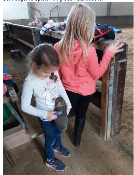
Die Kinder trainieren das Hufereinigen am Schuhprofil