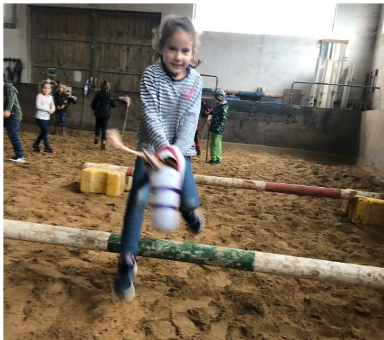
Reiterin und Pferd überwinden problemlos das Hindernis