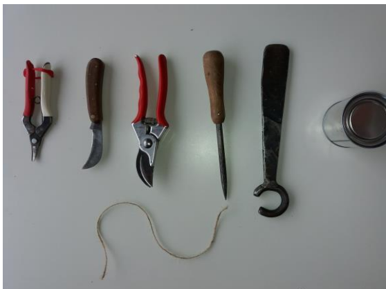
Das spezielle Handwerkzeug eines Korbflechters