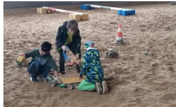
Sehr begehrt: Spielen im großen Sandbecken