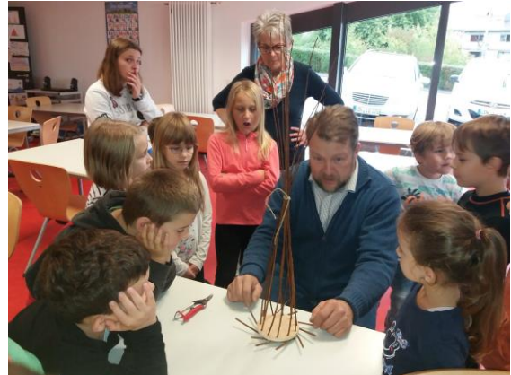
Das „Gerüst“ steht – nun werden die Weiden rund gelegt