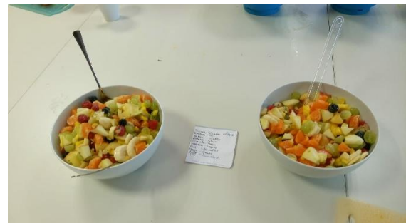
Gesundes Essen – ob Porridge oder exotischer Obstsalat