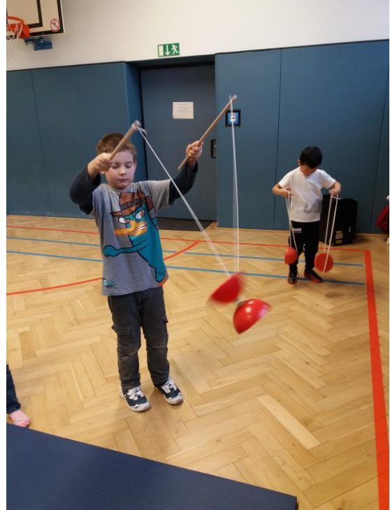
Ein Diabolo zu beherrschen erfordert enorme Geduld.