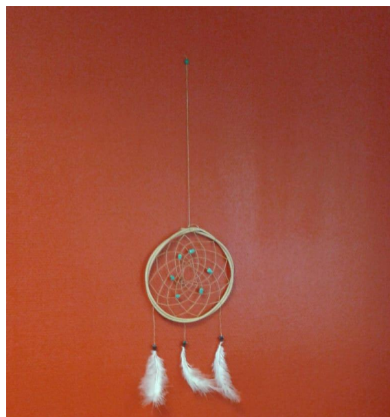
Ilona und Renate begeistern die Kinder für die Traumfänger und basteln wunderschöne Objekte

Der zweite Tag findet witterungsbedingt eher im Innenbereich statt. Wegen Sturm entfällt die Tour durch die Natur.