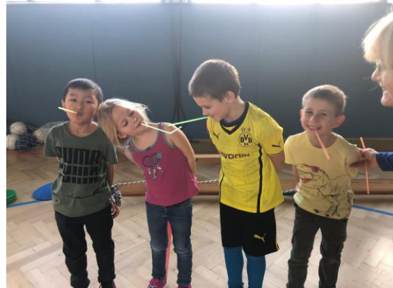
Gefesselt? Trickreiches Weitergeben eines Schlüssels...