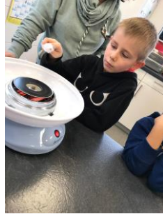
Selbst ist der Mann!