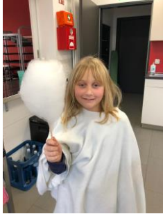
Lecker und klebrig!