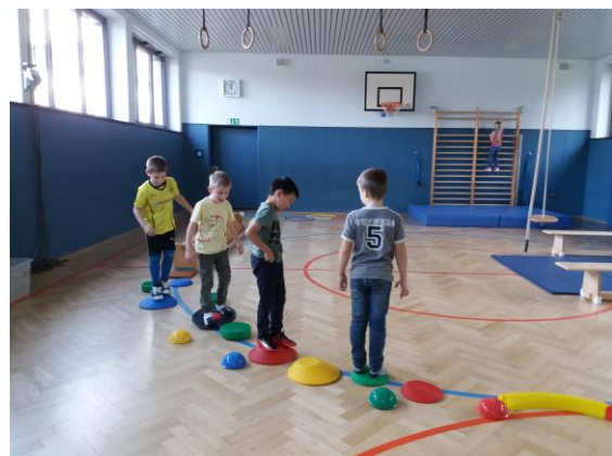
Bloß nicht ins Wasser treten! Balance ist hier gefragt.

Kulinarisches kommt nicht zu kurz. So ist die Produktion von Zuckerwatte natürlich am Tag der Gaukler und Clownereiein Highlight. Dafür wird auch die mitgebrachte Zuckerwatte-Maschine angeworfen.