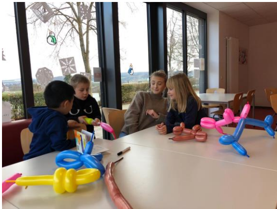
Lustige Luftballon-Figuren erfreuen Kinder und Betreuer