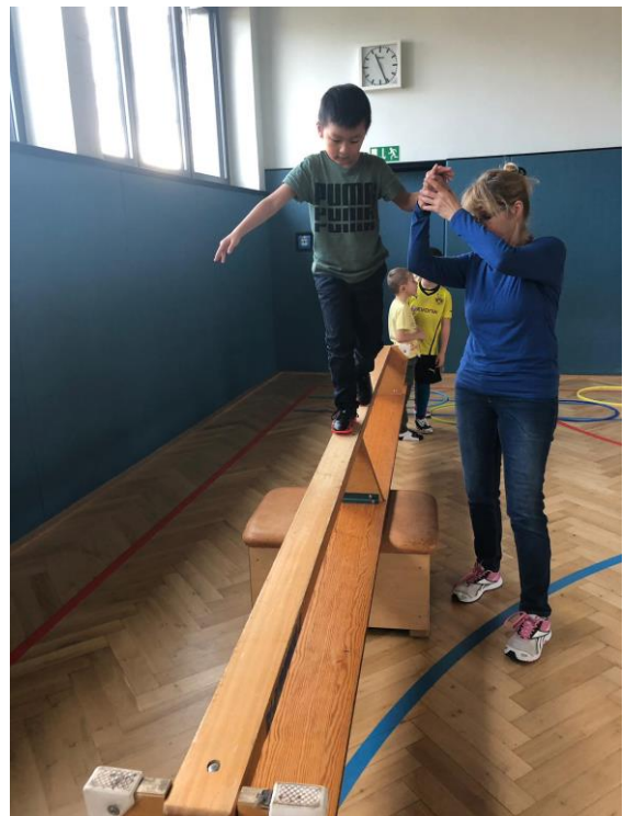
Wann kippt die Bank auf die andere Seite? Alle wollen sich an dem Mutprobe-Gerät testen. Verschiedene Fähigkeiten sind gefordert. Intensives Wahrnehmen, langsames Bewegen und spielerisches Training des Gleichgewichts formen die jungen Artisten.