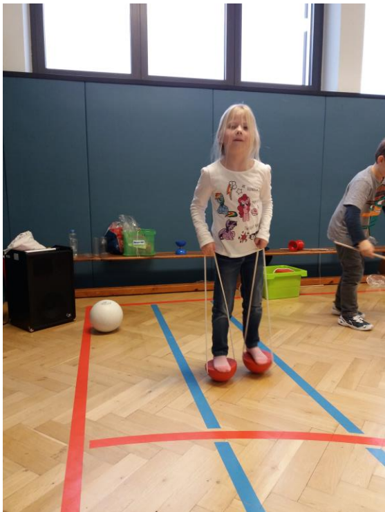
Zirkus in allen Facetten ist das Thema am Tag 5 – nicht nur in der Sporthalle. Wir malen Clowns und bewegen uns wie in der Manege.