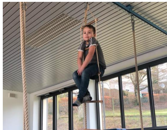
Ist Land oder ein Beute-Schiff in Sichtweite?