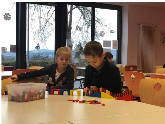
Soziales Miteinander bei Tischspielen im Innenbereich