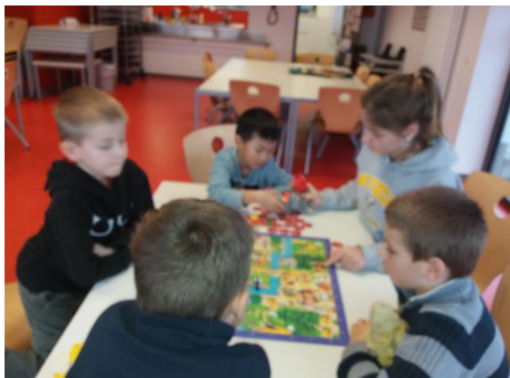
.... und Spaß beim neuen Spiel „WO war's...?“