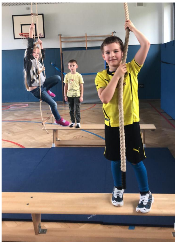
Die Piraten ertern Schiffe am Tag 3 in der Sporthalle.